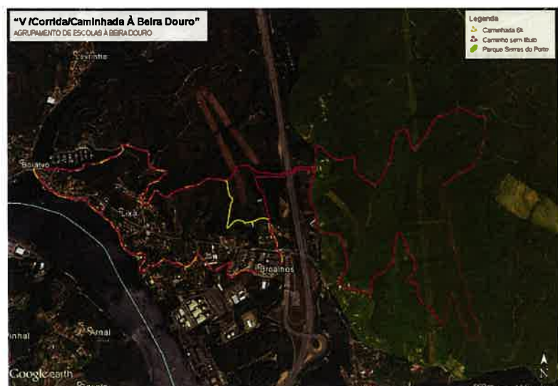
- Circuito a vermelho -

Analisado o processo, e recolhido parecer técnico junto do município abrangido, verifica-se que a atividade desportiva nas modalidades de corrida e caminhada atravessa o Parque das Serras do Porto nas Serras de Santa Iria e Banjas, conforme imagem, percorrendo a prova um total de 6km nesta área protegida, em trilhos e caminhos florestais existentes.