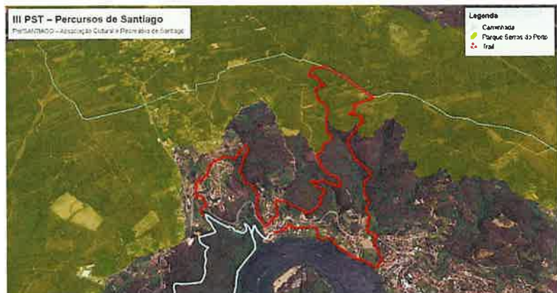
- Circuito a vermelho -

Analisado o processo, e recolhido parecer técnico junto do município abrangido, verifica-se que a atividade desportiva em causa atravessa o Parque das Serras do Porto na Serra de Sta. Iria, conforme imagem, percorrendo a prova um total de 4km nesta área protegida, em caminhos e trilhos florestais existentes.